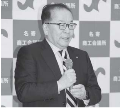
事業計画について語る大野会頭