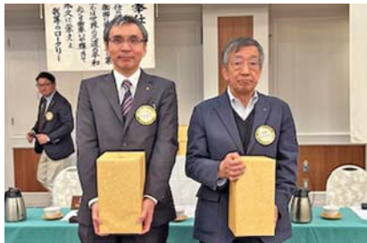
左から、池田会員、藤田会員